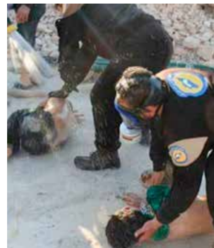
Primero fue el ataque químico, que causó indignación a nivel mundial.

En tanto, el segundo comunicado dice que los Gobiernos de Argentina, Chile, Colombia, México, Paraguay, Perú y Uruguay manifiestan su profunda preocupación ante la