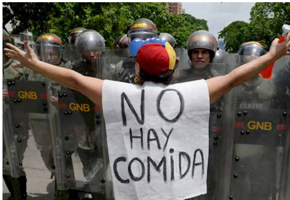
► Las largas filas para conseguir comida y supermercados desabastecidos han sido un punto crítico en el último tiempo en Venezuela.