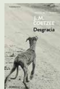
Desgracia J.M. Coetzee. Debolsillo, 2012.

Famoso por su prohibición en China en 1987, Saca la lengua es el libro que puso a su autor en la ruta del exilio. El título reúne el significado reverencial que se atribuye en el budismo tibetano al gesto de sacar la lengua, con la provocación y la disidencia de Occidente. En ésta obra, Ma Jian recurre a sus propias experiencias para hacer del Tíbet un escenario extraordinario de acontecimientos que fascinan y espantan.