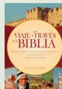
Un viaje a través de la biblia V. Gilbert Beers. Emecé, 2010.

A los cincuenta y dos años, David Lurie tiene poco de lo que enorgullecerse. Con dos divorcios a sus espaldas, apaciguar el deseo es su única aspiración; sus clases en la universidad son un mero trámite para él y para los estudiantes. Cuando se destapa su relación con una alumna, David, en un acto de soberbia, preferirá renunciar a su puesto antes que disculparse en público. Rechazado por todos, abandona Ciudad del Cabo y va a visitar la granja de su hija Lucy.