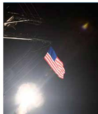
Trump ordena lanzamiento de misiles en respuesta al ataque químico.

escalada de violencia en Siria y condenan enérgicamente el inhumano empleo de armas químicas en contra de la población civil, en particular niños. El uso de armas químicas es un crimen de lesa humanidad y un crimen de guerra, proscrito por los tratados internacionales... “Hacemos un llamado a todas las partes involucradas, incluyendo a los actores con influencia en la región, ejercer la mayor prudencia para evitar una escalada de las tensiones y para encontrar una solución política a la muy compleja y dramática situación en Siria, bajo los auspicios de las Naciones Unidas”.