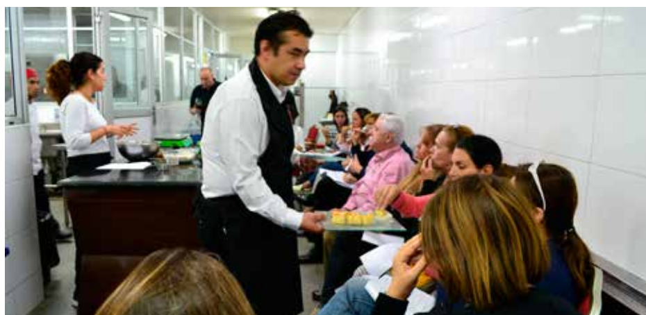
► Degustación de los platillos que se enseñaron.