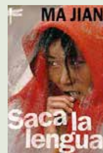
Saca la lengua Ma Jian. Emecé, 2006.

Famoso por su prohibición en China en 1987, Saca la lengua es el libro que puso a su autor en la ruta del exilio. El título reúne el significado reverencial que se atribuye en el budismo tibetano al gesto de sacar la lengua, con la provocación y la disidencia de Occidente. En ésta obra, Ma Jian recurre a sus propias experiencias para hacer del Tíbet un escenario extraordinario de acontecimientos que fascinan y espantan.