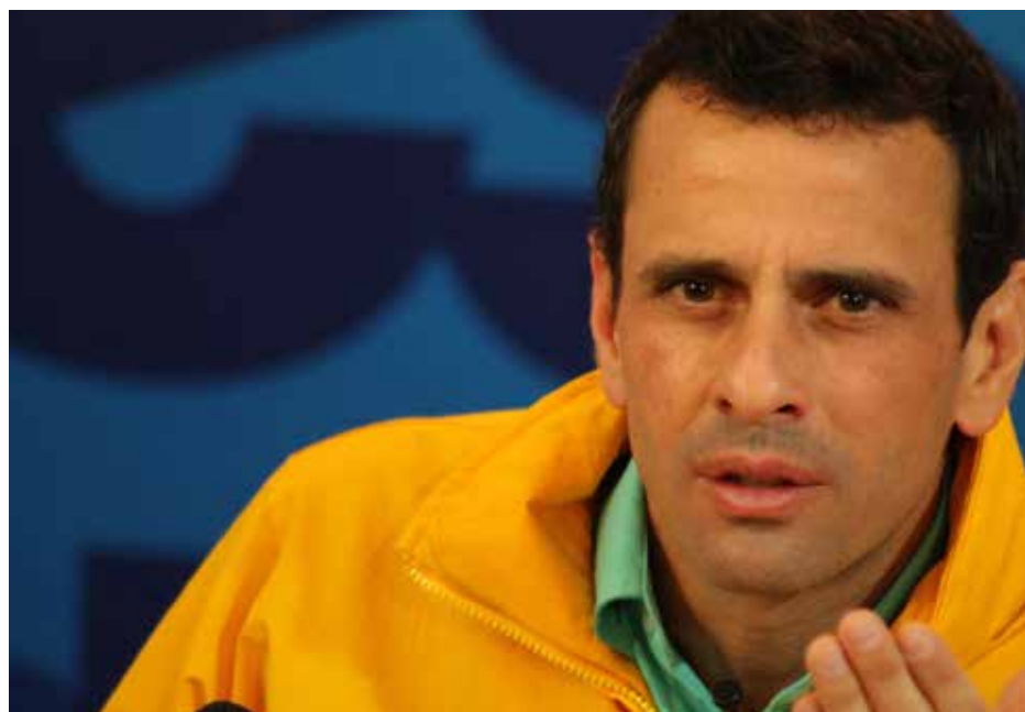
► Las autoridades venezolanas impusieron una inhabilitación administrativa por 15 años al líder opositor y excandidato presidencial Henrique Capriles Radonski.