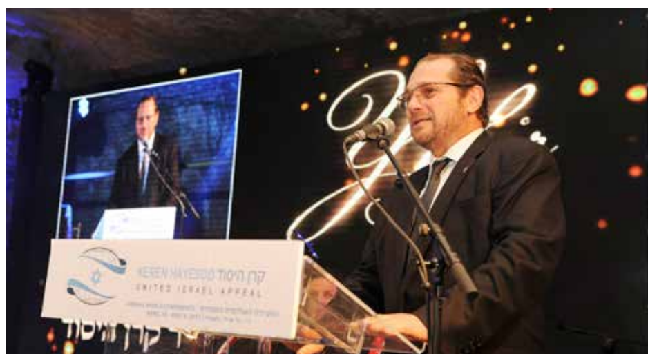
► El Presidente del Keren Hayesod Chile agradeció emocionado tan importante distinción.