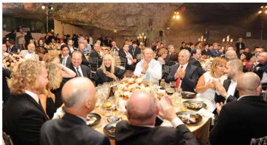
► El reconocimiento se realizó en Jerusalem durante una cena de gala en la "Caverna de Tzidkiyahu".