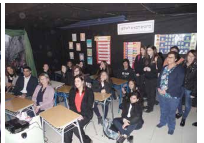
► En el ulpán de la Tajaná del Instituto Hebreo.