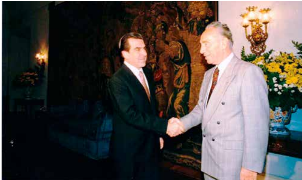
► Shimon Peres visita al Presidente Eduardo Frei Ruiz Tagle en La Moneda durante su segunda visita a Chile en 1997.

Peres, a decir verdad, escribí en La Palabra Israelita, asumió durante su visita "la calidad de ciudadano del mundo preocupado de los problemas del mundo", permitiendo a los chilenos, a través de su persona e intervenciones, "conocer al verdadero Israel".