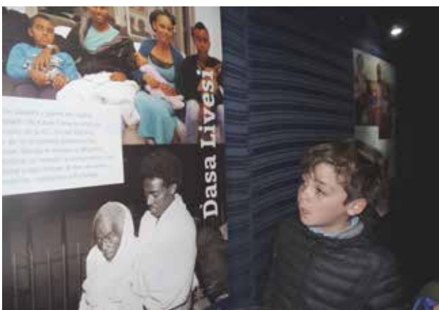
► Alumnos desde 3° Básico hasta 3° Medio visitaron las tajanot y la obra de teatro "Mi Jalom le Metziut" montadas en el Salón Multiuso durante la "Semana del Keren Hayesod 2016".