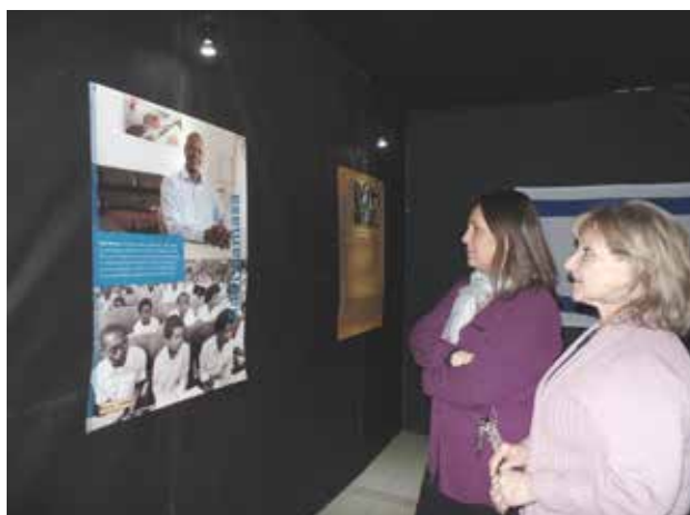
► En la foto, en la exposición de la "Operación Moisés" de la Tajaná del Keren Hayesod.