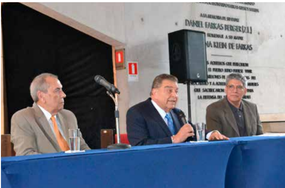
► Mario Kreutzberger realiza la presentación del libro.