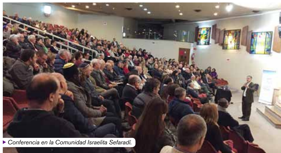
► Conferencia en la Comunidad Israelita Sefaradí.

Sorprendido se mostró al enterarse de la campaña de la Federación Palestina, que incluyó un boicot académico, un inserto con información falsa en El Mercurio y las agresiones de las que fueron vícti-