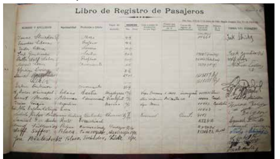
► Libro de registro de hospedaje . 1 de junio de 1928.