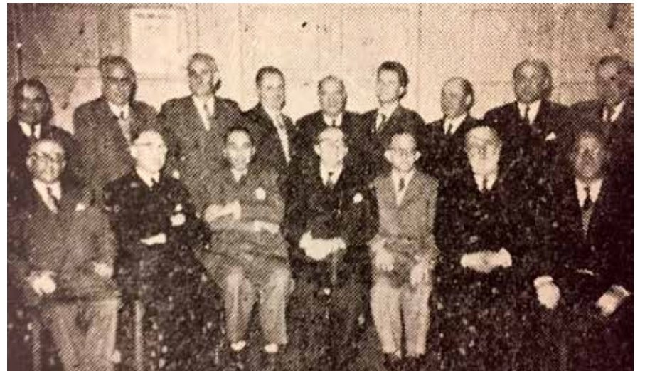
► Directorio Bicur Joilim. Periodo 1956 - 1957.