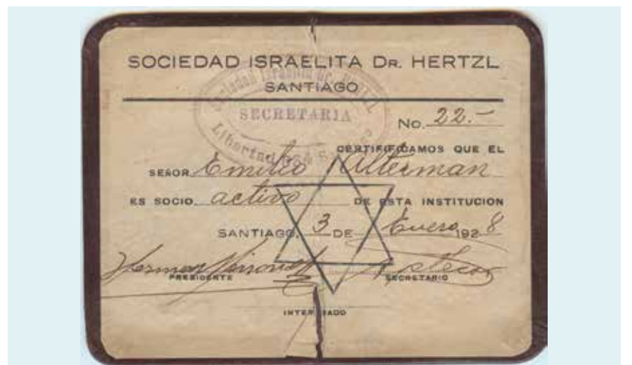
► Carnet de socio. Año 1928.