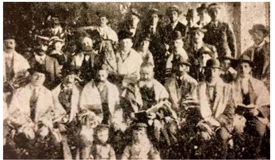
► Iom Kipur en Bicur Joilim. Año 1956.