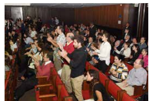
El público disfrutó y bailó con el concierto de Idan Raichel