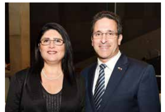
Embajador de Israel en Chile, Eldad Hayet y su esposa Mijal.