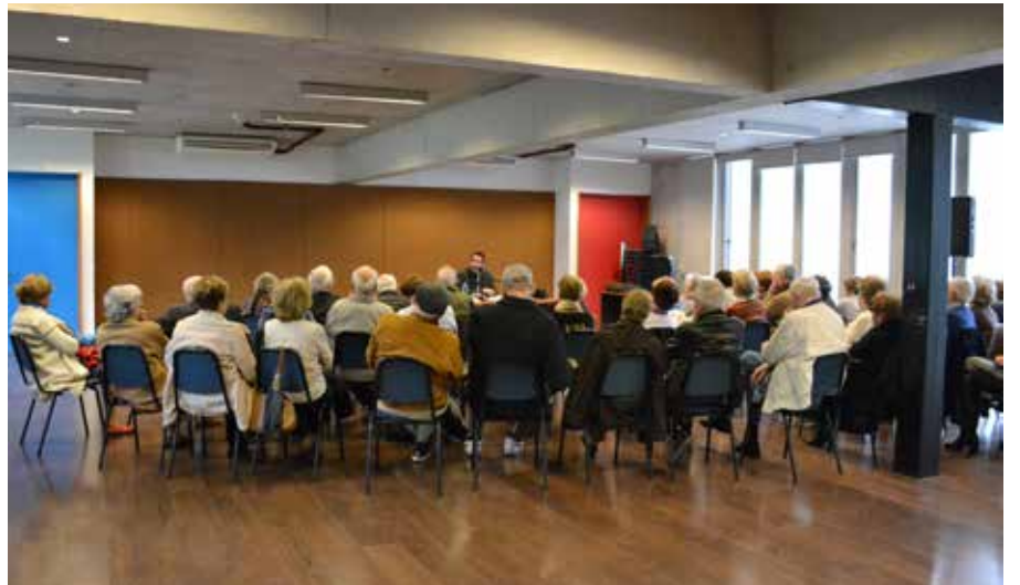
► Más de 30 adultos mayores asistieron a esta charla organizada por el Centro de Encuentro del Adulto (CEA).