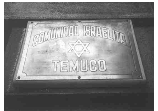
► Sinagoga y entrada a la Comunidad Israelita de Temuco.