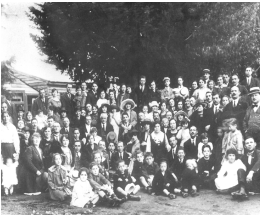
► Comunidad judía de Temuco, se reúne para celebrar la Declaración de Balfour.