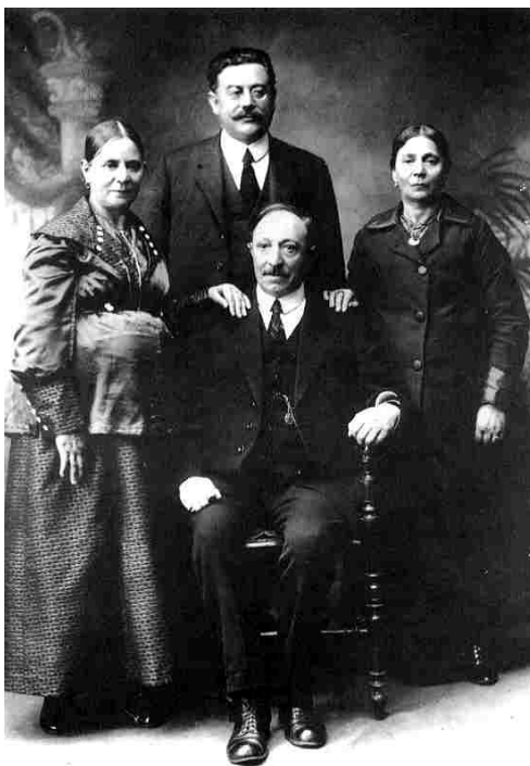
► La primera familia judía en Temuco.