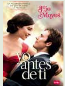
Yo antes de ti Jojo Moyes. Suma, 2016.

L ou Clark sabe muchas cosas. Sabe cuántos pasos hay entre la parada del autobús y su casa. Sabe que le gusta trabajar en el café Buttered Bun y sabe que quizá no quiera a su novio Patrick. Lo que Lou no sabe es que está a punto de perder su trabajo o que son sus pequeñas rutinas las que la mantienen en su sano juicio. Will Traynor sabe que un accidente de moto se llevó sus ganas de vivir. Sabe que ahora todo le parece insignificante y triste y sabe exactamente cómo va a ponerle fin. Lo que Will no sabe es que Lou está a punto de irrumpir en su mundo con una explosión de color. Y ninguno de los dos sabe que va a cambiar al otro para siempre.