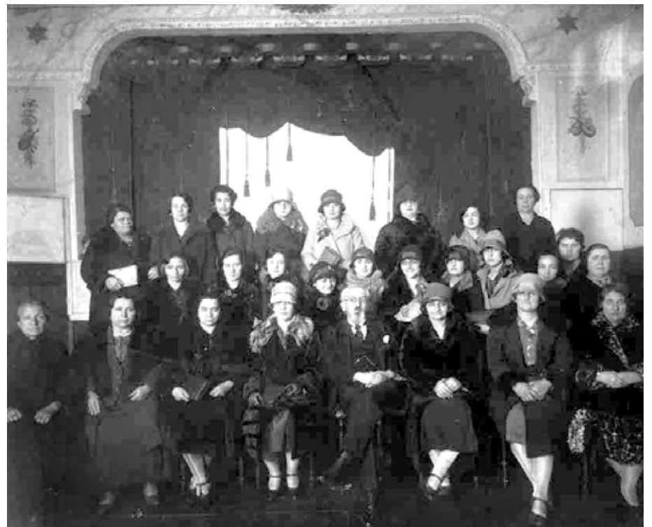
► La Sociedad de Damas junto al Rabino Djaen.