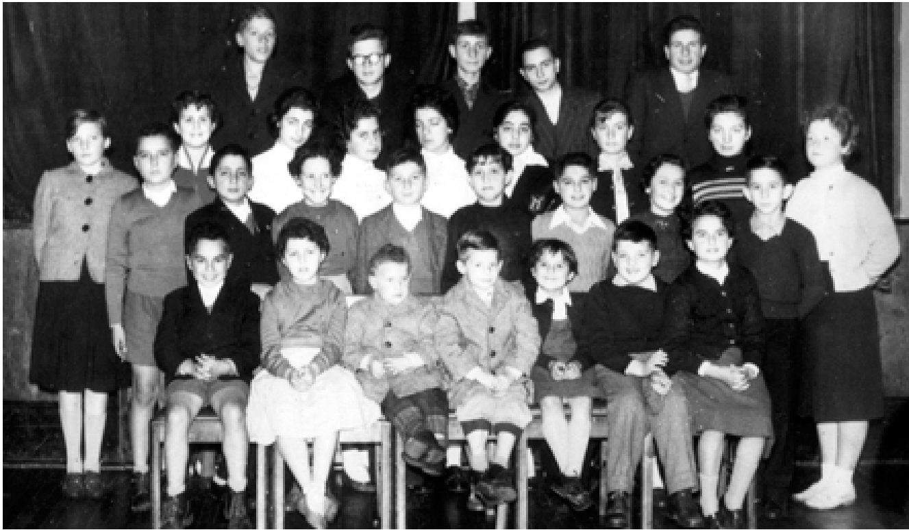
► Colegio Hebreo de Temuco.