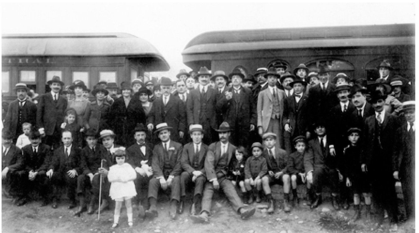
► Comunidad judía de Temuco en la estación.