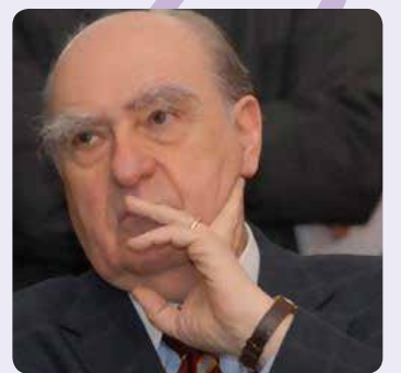
(Julio María Sanguinetti, ex Presidente del Uruguay, en su artículo “El hoy del ayer”, publicado en el diario “El País”, de Montevideo, en el marco de la conmemoración de la Guerra de los Seis Días”).

Cincuenta años después seguimos en un debate que suma todas las intransigencias contra Israel. Ya no se invoca el antisemitismo. La consigna ahora es el “antisionismo”. El primero desprecia a las personas, el segundo niega el derecho a que esas personas puedan reunirse en una nación. Es contra lo que todavía tenemos que luchar quienes, a lo largo de toda nuestra vida, hemos abrazado la causa de ese Estado que dio hogar al pueblo más perseguido de la historia”.