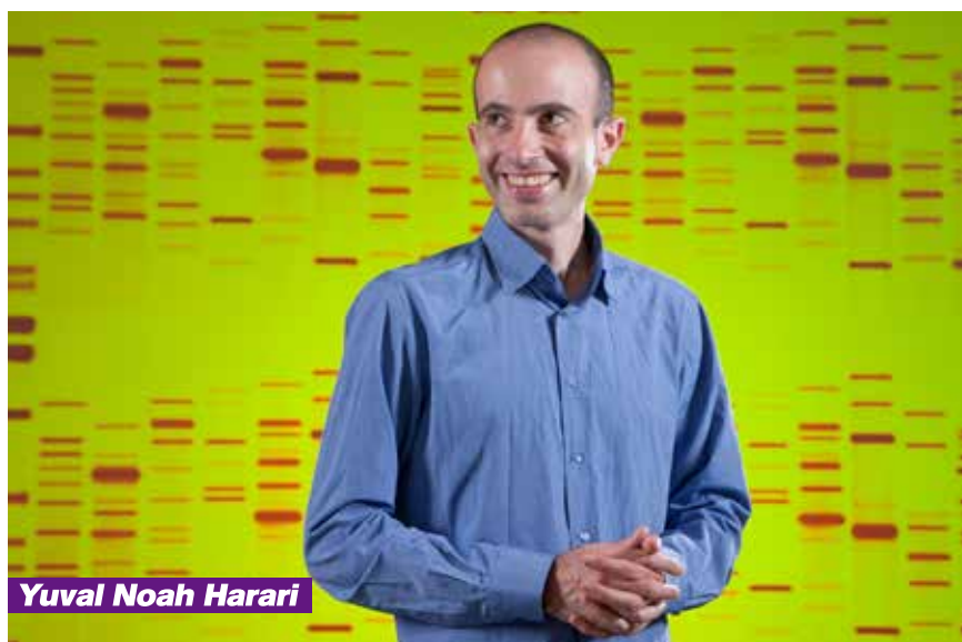
Yuval Noah Harari