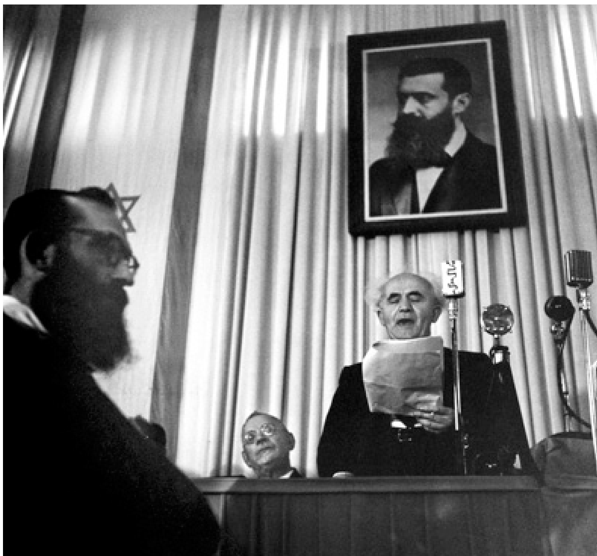
Ben Gurión en ceremonia de Declaración del Estado de Israel.

Por eso Capa es referente ineludible a la hora de dar idea de la práctica del fotoperiodismo como una actividad humana, en lugar de una mecánica.