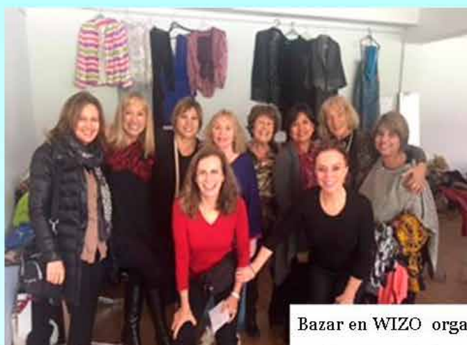
Bazar en WIZO organizado por el grupo Athid