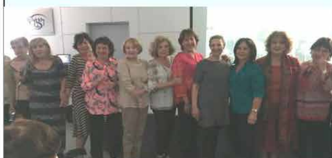
Cine en WIZO, Grupo Carmel