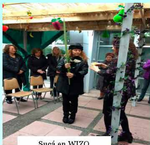
Sucá en WIZO

Casa WIZO: Generando encuentros , creamos momentos para compartir