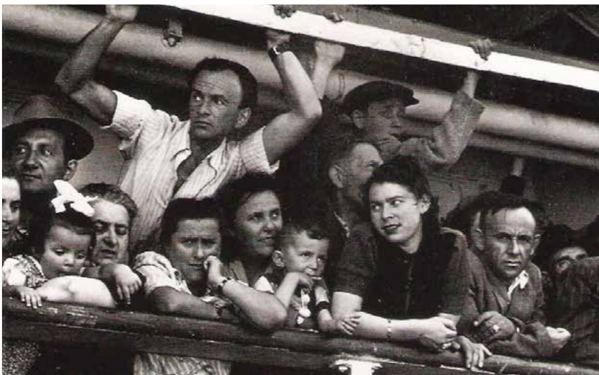
Arribo de refugiados al Puerto de Haifa.