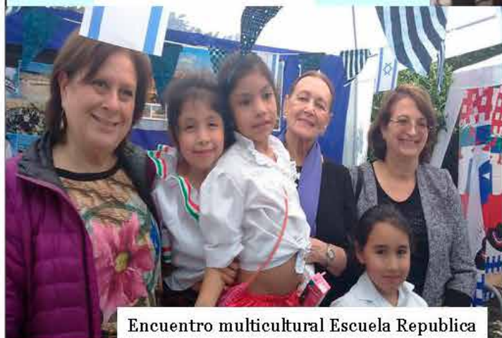
Encuentro multicultural Escuela Republica