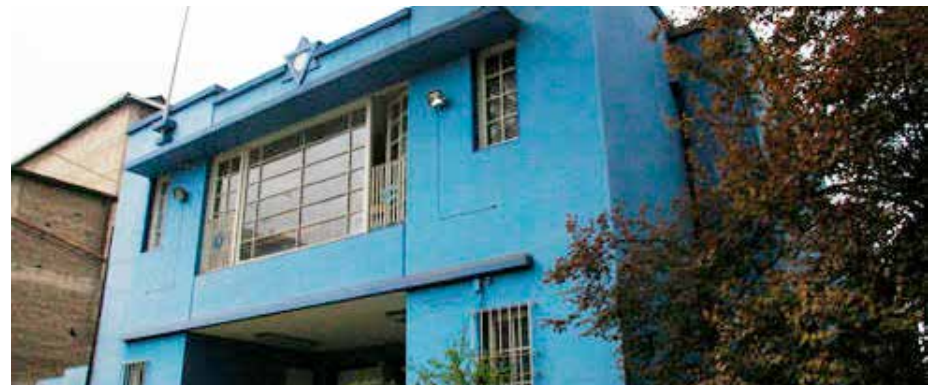
► Fachada del Bicur en Avenida Matta.