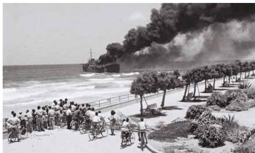
Destrucción del buque Altalena.