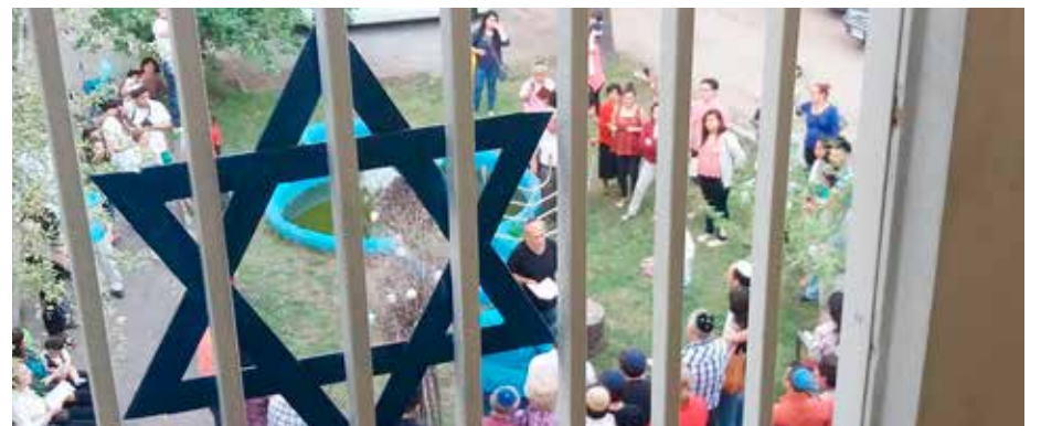
► Januca en la piletta del Bicur.