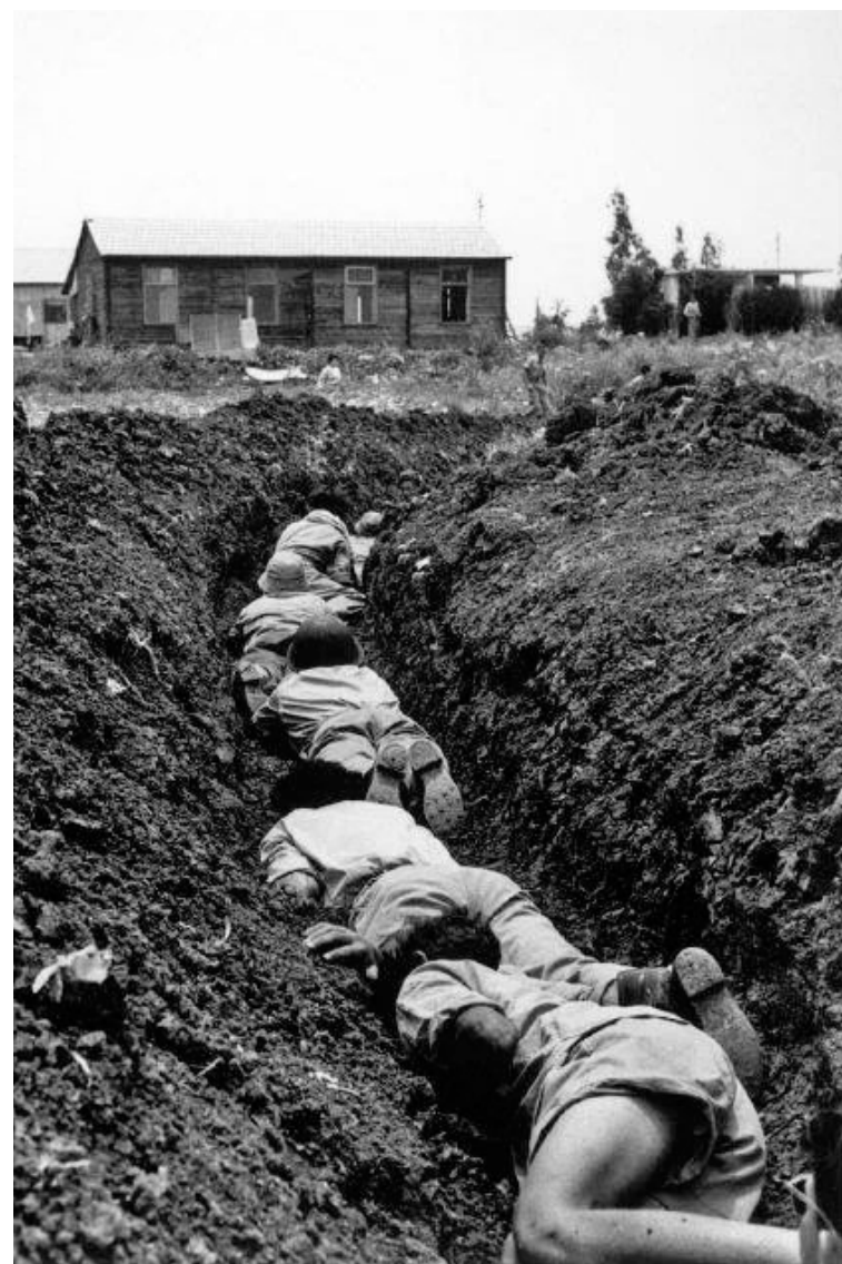
Jalutzim de Hashomer Hatzair se refugian del bombardeo egipcio a kibutz Negba.

Pero Capa fue también un aventurero, mujeriego, un contador de historias, uno de aquellos que siempre terminan rodeadas de otros tan famosos como él. Fue amigo de Ernest Hemingway y su esposa (la corresponsal de guerra Martha Gellhorn), Gary Cooper, Irwin Shaw y Gene Kelly. Así podemos verlo en Rusia con John Steinbeck, en Italia con John Huston, en la Riviera con Picasso y con Ingrid Bergman.