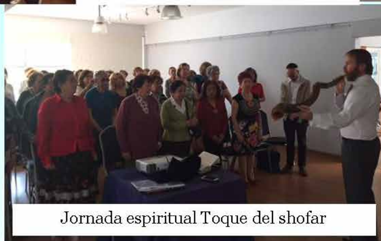
Jornada espiritual Toque del shofar