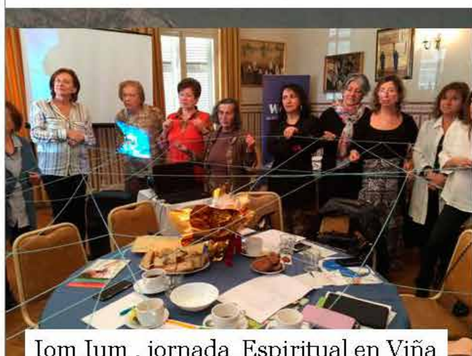
Iom Ium , jornada Espiritual en Viña