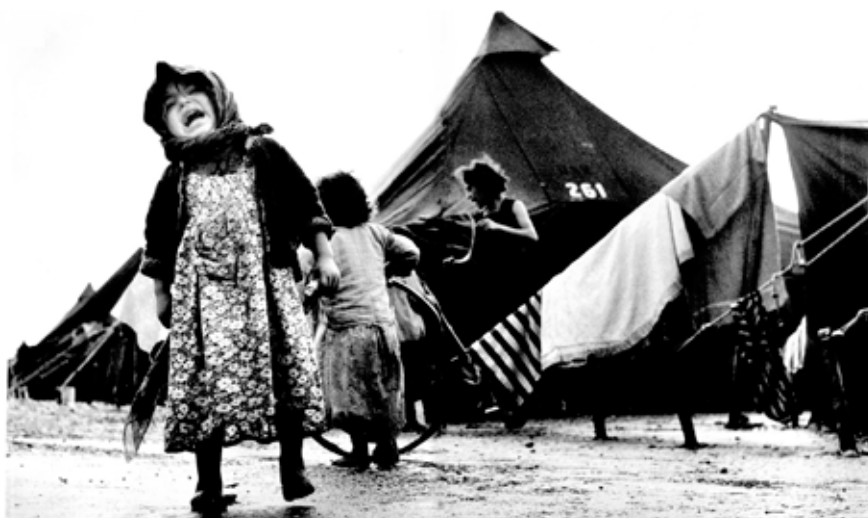
Campamento para inmigrantes Sha'ar Ha'aliya.