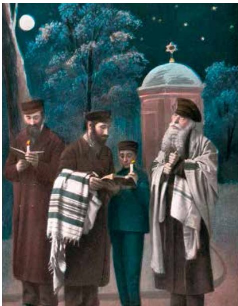
Postal de Rosh Hashaná ilustrando Kidush Levanah, bendición de la luna nueva al final de Iom Kipur.