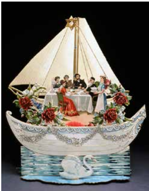
Tarjeta de Rosh Hashaná de la colección de Yeshiva University.

El hecho es que los judíos durante ese periodo buscaron tanto participar en el fenómeno de las tarjetas postales, como también enviar un mensaje social importante. Una intensidad que está contenida en la palabra hebrea para tarjeta postal: miltav galui (carta abierta); el deseo de mirar y ser mirado entre sus pares, pues tanto la impresión como la adquisición de tarjetas postales, significaba la aceptación y reafirmación de la imagen pública era retratada a través de ellas.