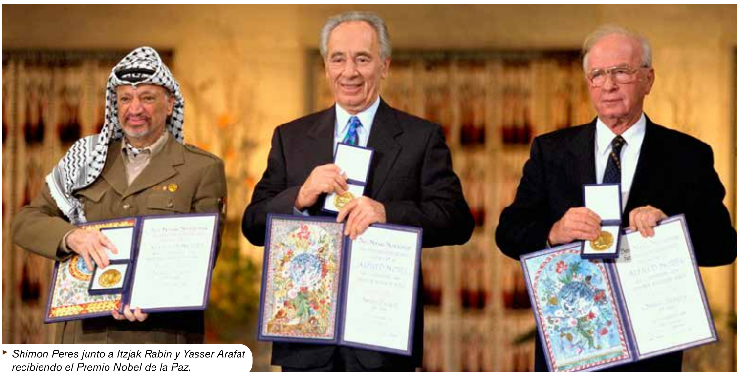
► Shimon Peres junto a Itzhak Rabin y Yasser Arafat recibiendo el Premio Nobel de la Paz.

A pesar de haber sido halcón durante los años 70 por su apoyo a los colonos en Cisjordania, con el tiempo se convirtió en una paloma. Comprendió que Israel necesitó seguridad en sus primeras décadas de vida, no obstante propició la paz como único medio para el porvenir del país. Sin duda, su gran legado, a pesar de haber perdido en muchísimas elecciones, fue persistir políticamente aún en las grandes derrotas y mantener vigente el mensaje que el Estado de Israel, siempre con esperanza, busca lograr la reconciliación con sus vecinos, vislumbrando un futuro compartido.