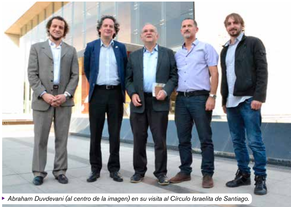
► Abraham Duvdevani (al centro de la imagen) en su visita al Círculo Israelita de Santiago.

-Primero porque siempre en América Latina ha existido la idea de que están al final de nuestras prioridades, por la distancia desde Israel, por el español -en comparación a los países de habla inglesa-, y todo eso. Y primero abordamos el trabajo de erradicar esa idea, no es bueno que se sientan así, y así poner a América Latina en el tope de las prioridades. En segundo lugar, las comunidades judías en Latinoamérica son muy fuertes en su amor a Israel y compromiso, es mucho más fácil trabajar acá, y por eso hemos decidido enfocar los recursos a esta región.