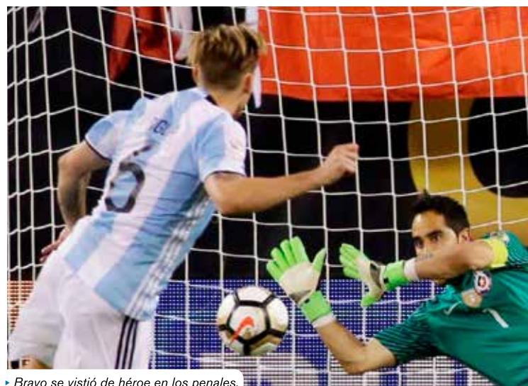
► Bravo se vistió de héroe en los penales.