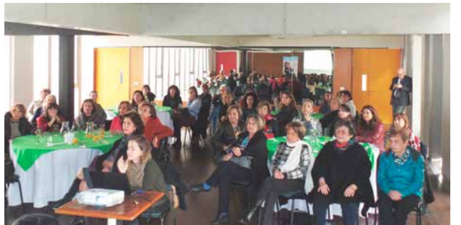
► Las asistentes pudieron consultar todas sus inquietudes al destacado profesional.