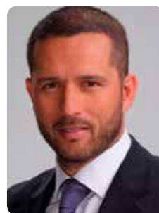
Rodrigo Goldberg. Comentarista y ex futbolista.

“Este grupo es más fuerte que otros por el convencimiento de que pueden. Esto si lo hacen entre todos. Argentina confía en sus nombres propios, lo mismo que Colombia. Brasil apela a su historia como respaldo. Chile es el único sudamericano que se apoya 100% en la fuerza colectiva. Ellos lo saben y en momentos de flaqueza se agrupan sabiendo que ahí son fuertes”, asegura Rodrigo Goldberg.