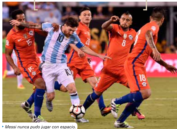
► Messi nunca pudo jugar con espacio.

Algunas de las claves de la final de la Copa América Centenario 2016