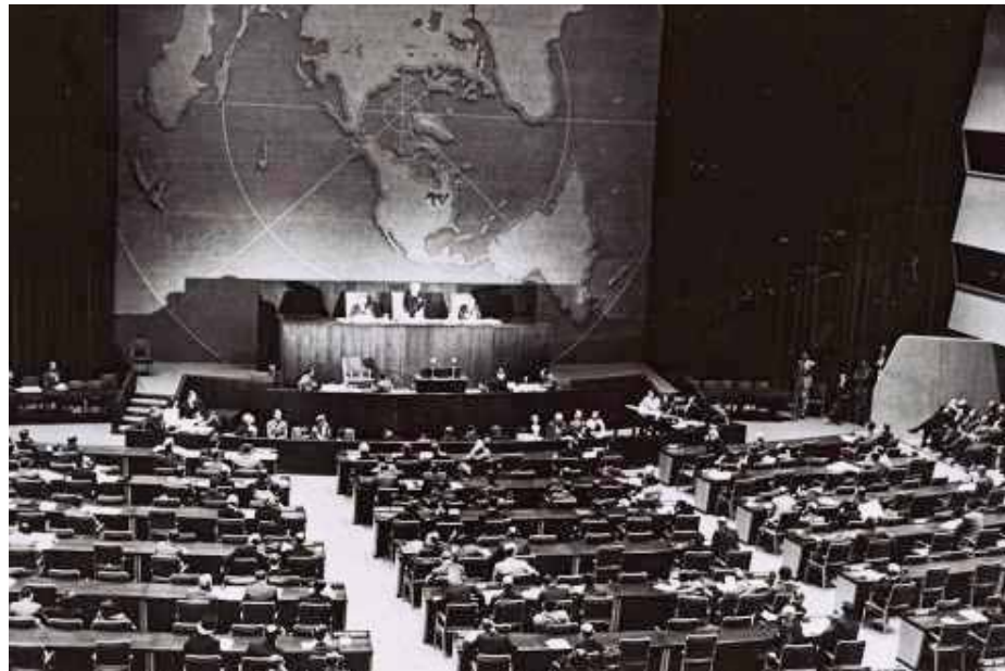
Naciones Unidas, noviembre de 1947.