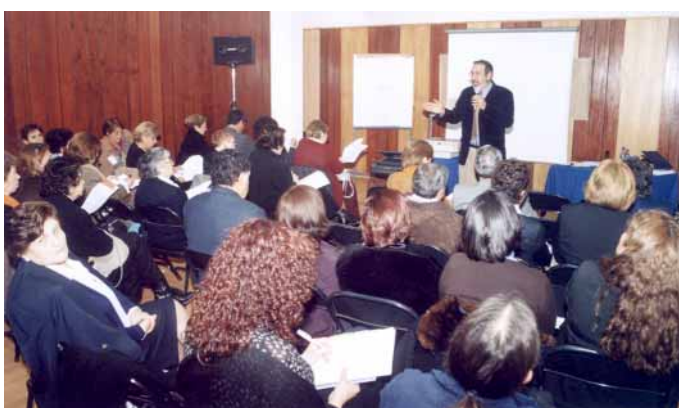
Profesor Abraham Magendzo dictando una charla.

sobre los Objetivos Transversales Fundamentales del Currículo Educacional. Estos objetivos son asumidos por el currículo en su conjunto y fomentan el desarrollo del pensamiento creativo y crítico, fortalecen la formación ética, la autoafirmación y las relaciones interpersonales y con el entorno.