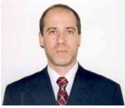
POR ISAÍAS WASSERMANN

Por suerte son solamente tres: Schaulsohn, Sepúlveda y Narváez.