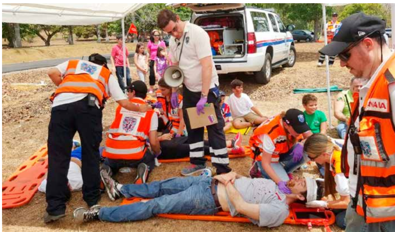
► Voluntarios de United Hatzalah participan en un simulacro de accidentes en Israel.

Desde su Centro de Mando, United Hatzalah utiliza una avanzada tecnología basada en el sistema de telefonía GPS para identificar a los voluntarios más próximos y más calificados, que están cerca de una emergencia y las rutas de los voluntarios, todo ello a través de una aplicación para dispositivos móviles. Los cuadros de voluntarios civiles entrenados en todo Israel crean una red de socorristas, cada uno de ellos está equipado con motocicletas adaptadas como ambulancias, capaces de